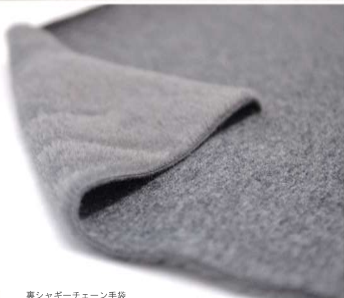
裏シャギーチェーン手袋