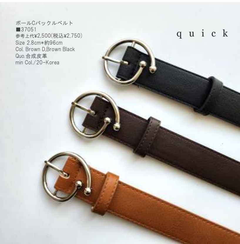
パールCバックルベルト ■37051 参考上代¥2,500(税込¥2,750) Size 2.8cm*約96cm Col. Brown D,Brown Black Quo.合成皮革 min Col./20-Korea