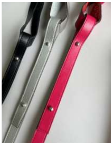
本革ミニバッグ ■35104 参考上代¥4,500(税込¥4,950) Size 約H19*W14*D5cm Col. Pink Silver Black Quo. 牛革 再生革 min Col/200pcs-China-50days