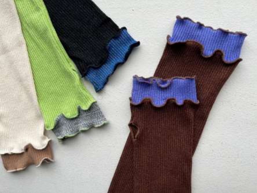
バイカラーメローームカバー ■36112 参考上代¥2,500(税込¥2,750) Size 約全長40cm Col. Brown/Purple Black/BlueMix Lime/GryaMix Ivory/Camel Quo. レーヨン45% ポリエステル26% ナイロン24% ポリウレタン5% min Col/200pcs-China-50days