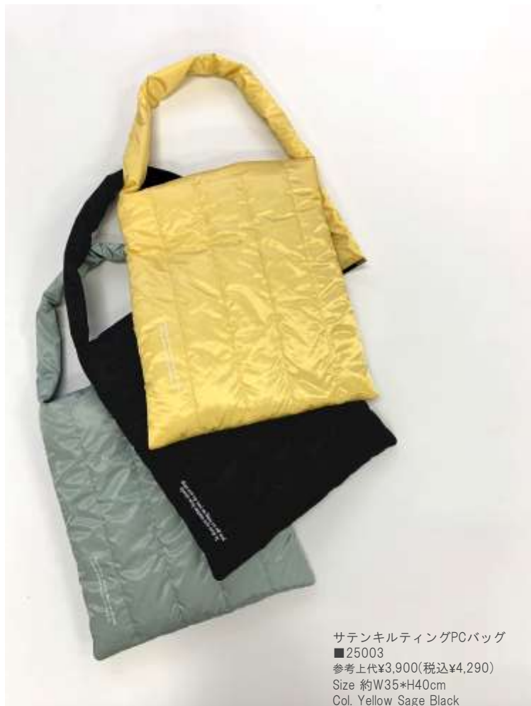
サテenkilティングPCバッグ ■25003 参考上代¥3,900(税込¥4,290) Size 約W35*H40cm Col. Yellow Sage Black Quo. ポリエステル min Col/400pcs-China-50days