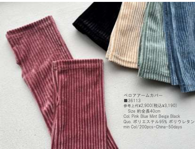
ペロアームカバー ■36113 参考上代¥2,900(税込¥3,190) Size 約全長40cm Col. Pink Blue Mint Beige Black Quo. ポリエステル95% ポリウレタン5% min Col/200pcs-China-50days