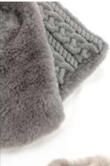
ファーニットマフラー ■32202 参考上代¥4,500 (税込¥4,950) Size Col. Beige Gray Quo. min Col/300pcs-China-50days