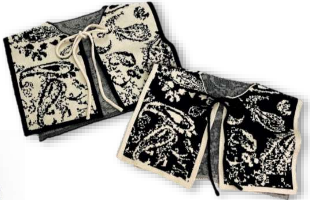
ニット付け襟 ■32007 参考上代¥3,500(税込¥3,850) Size 約35*23/25cm Col. Ivory Black Quo. ポリエステル ナイロン レーヨン min Col/300pcs-China-50days