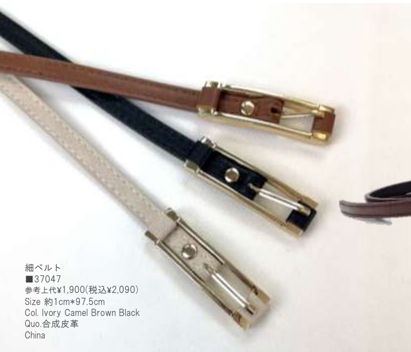
細ベルト ■37047 参考上代¥1,900(税込¥2,090) Size 約1cm*97.5cm Col. Ivory Camel Brown Black Quo.合成皮革 China