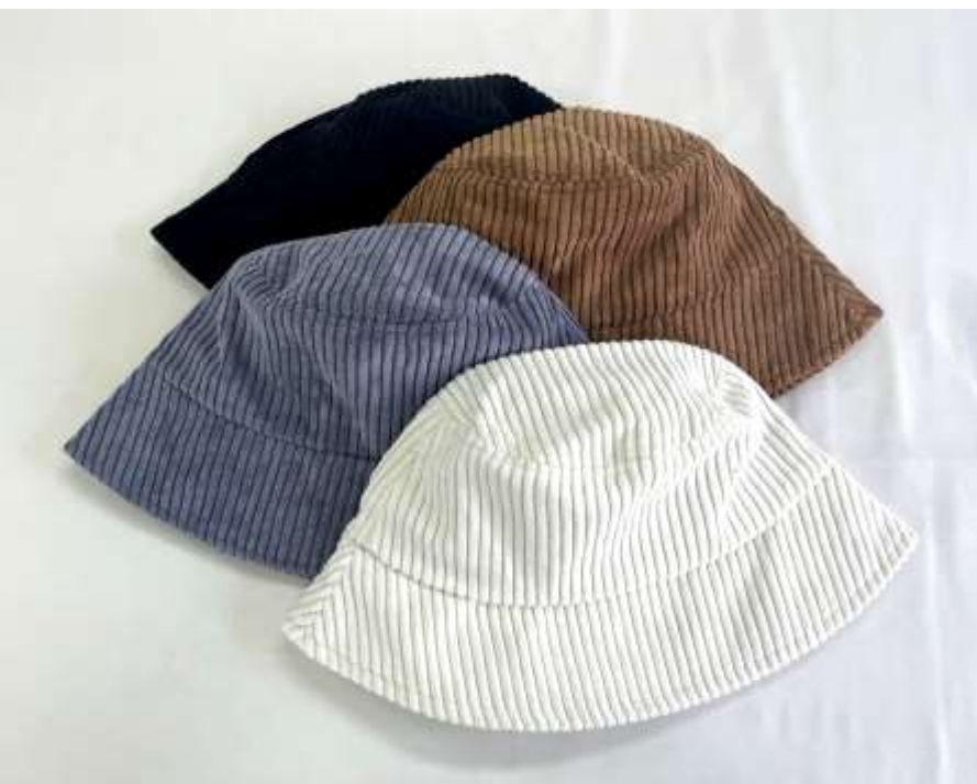
コーデュロイバケットハット ■34110 参考上代¥3,200(税込¥3,520) Size 頭周約57cm Col. Off White Blue Camel Black Quo. min Col/200pcs-China-50days