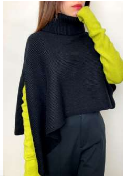
アシンメトリーニットポンチョ ■31017 参考上代¥5,500(税込¥6,050) Size Free Col. Ivory Beige Black Quo. min Col/500pcs-China-50days