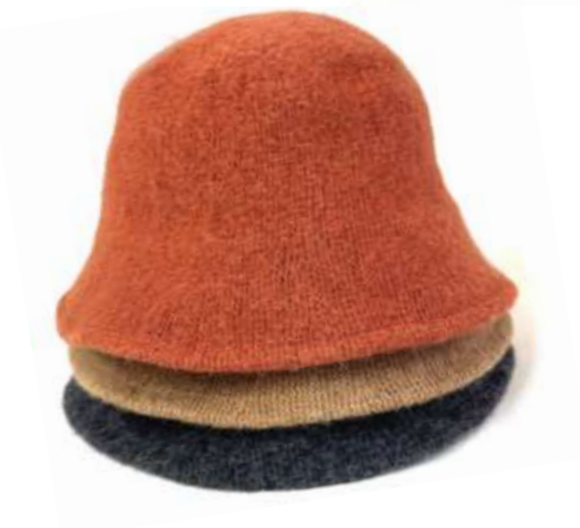
ニットチューリップハット ■29113 参考上代¥3,900(税込¥4,290) Size 頭周約58cm Col. Camel Orange Gray Quo. min Col/200pcs-China-50days