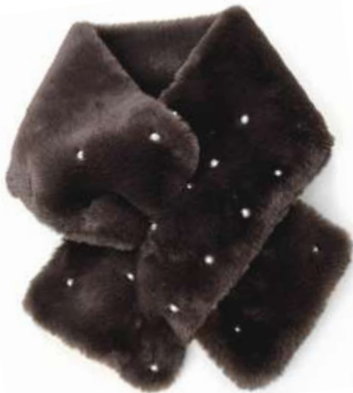
パールファーマフラー ■32204 参考上代¥3,500 (税込¥3,850) Size Col. Brown Gray Quo. min Col/300pcs-China-50days