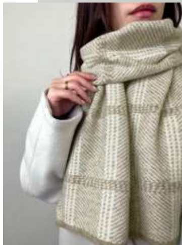
チェックニットマフラー ■31024 参考上代¥3,500 (税込¥3,850) Size 約25*164cm Col. Pink Brown Quo. アクリル min Col./500pcs-China-50days