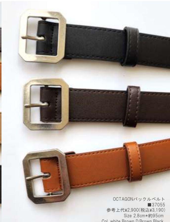
OCTAGONバックルベルト ■37055 参考上代¥2,900(税込¥3,190) Size 2.8cm*約95cm Col. white Brown D,Brown Black Quo.合成皮革 min Col./20-Korea