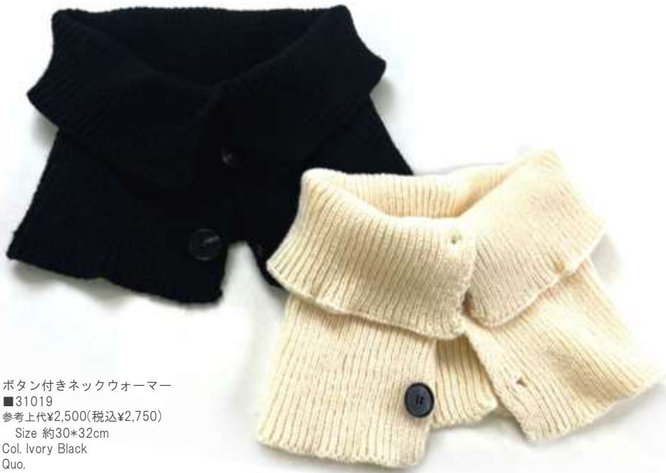
ボタン付きネックウォーマー ■31019 参考上代¥2,500(税込¥2,750) Size 約30*32cm Col. Ivory Black Quo. min Col/500pcs-China-50days