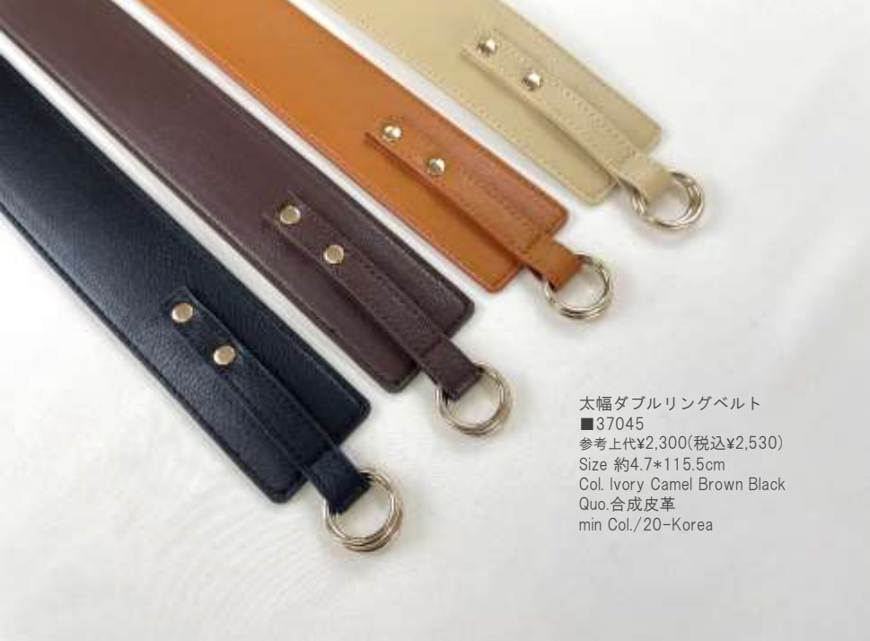
太幅ダブルリングベルト ■37045 参考上代¥2,300(税込¥2,530) Size 約4.7*115.5cm Col. Ivory Camel Brown Black Quo.合成皮革 min Col./20-Korea