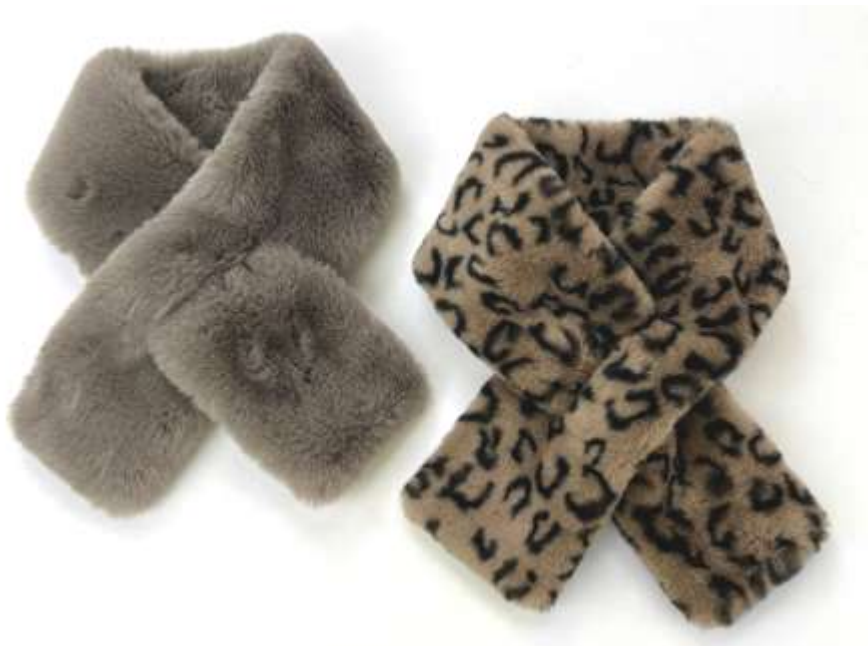
ファーナローマフラー ■32203 参考上代¥3,200 (税込¥3,520) Size Col. Graige Leopard Quo. min Col/300pcs-China-50days