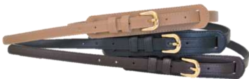
スムーズホールベルト ■27014 参考上代¥3,700(税込¥4,070) Size 約1.4~3*102cm Col. Beige Brown Black Quo. 合成皮革 min Col./20-Korea