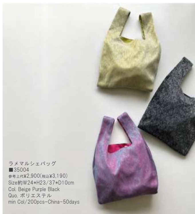
ラメマルシェバッグ ■35004 参考上代¥2,900(税込¥3,190) Size約W24*H23/37*D10cm Col. Beige Purple Black Quo. ポリエステル min Col/200pcs-China-50days