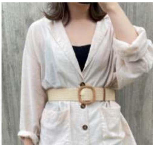
スクエアバックルゴムベルト ■37002 参考上代¥4,200(税込¥4,620) Size 約4.5cm*96cm Col. Beige Brown Black Quo. ポリエステル min Col./30-China