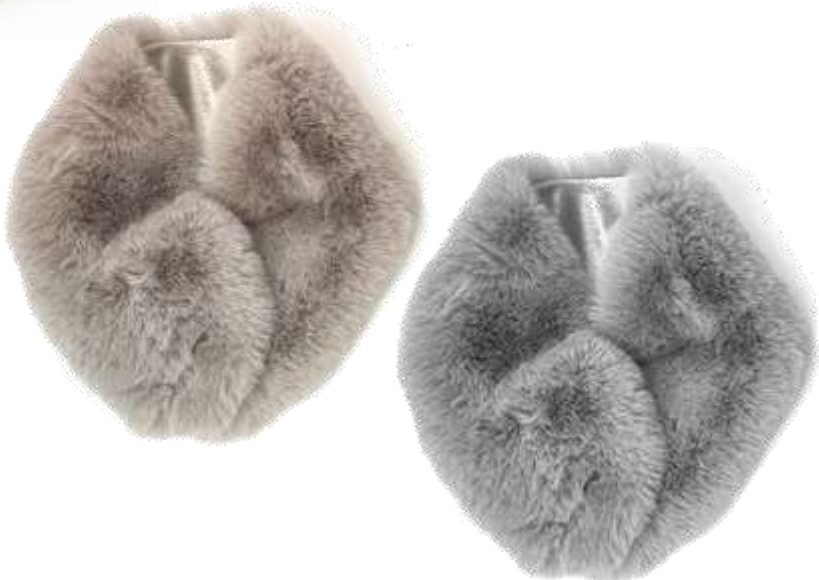
ファーマグネットマフラー ■32205 参考上代¥3,700 (税込¥4,070) Size Col. Beige Gray Quo. min Col/300pcs-China-50days