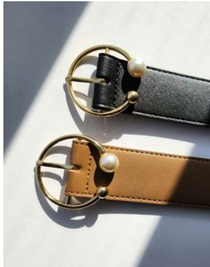
パール×パールCバックルベルト ■37053 参考上代¥2,700(税込¥2,970) Size 3.3cm*約96cm Col. Camel Black Quo.合成皮革 min Col./20-Korea