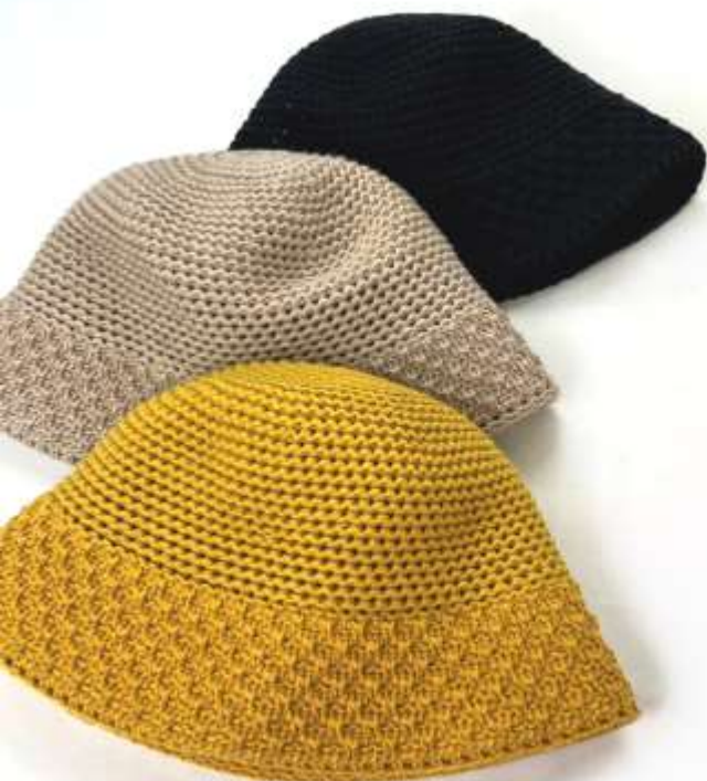
透かし編みニットハット ■29107 参考上代¥3,900(税込¥4,290) Size 頭周約57cm Col. Yellow Beige Black Quo. min Col/200pcs-China-50days