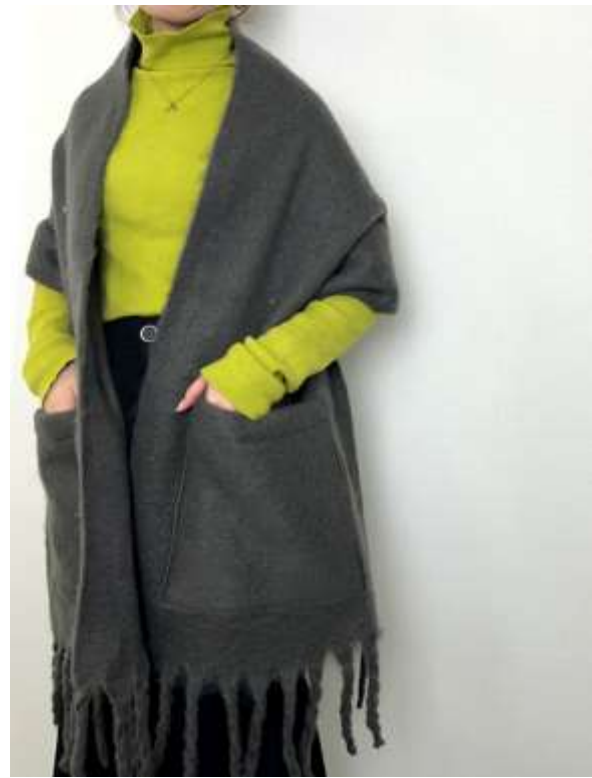
ポケット付きボリュームストール ■31009 参考上代¥3,900 (税込¥4,290) Size 約40*210cm(房込) Col. Ivory Purple Charcoal Quo. ポリエステル min Col/500pcs-China-50days