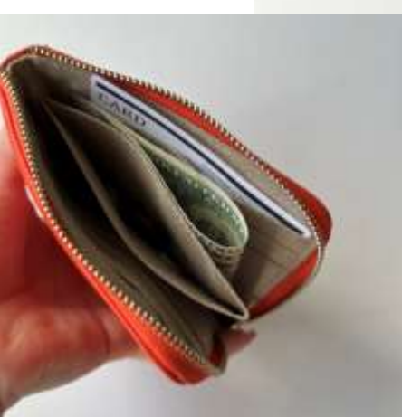
本革L字ウォレット ■35101 参考上代¥3,900(税込¥4,290) Size 約11.5*9.5cm Col. Mint Orange Pink Black Silver Gold Quo. 牛革 min Col/200pcs-China-50days