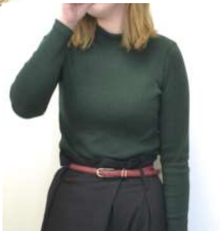
ダブルサル管ベルト ■27028 参考上代¥2,500(税込¥2,750) Size 1.5cm*95cm Col. White Beige Brown Wine Black Quo. 合成皮革 min 1style/1000-China 進行有無や在庫数量が変動しますので、ご検討の際にお問合せください。