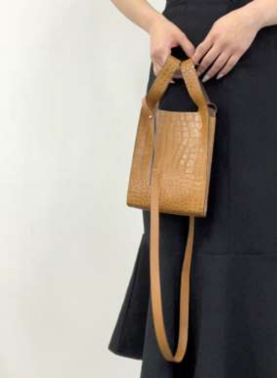
クロコ調ミニバッグ ■35106 参考上代¥4,900(税込¥5,390) Size 約H19*W14*D5cm Col. Camel Black Quo. 牛革 再生革 min Col/200pcs-China-50days