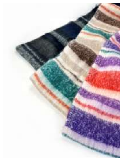
ストライプポリリュームスヌード ■31006 参考上代¥2,700 (税込¥2,970) Size 約30*80*2cm Col. Purple Brown Black Quo. ポリエステル min Col/500pcs-China-50days