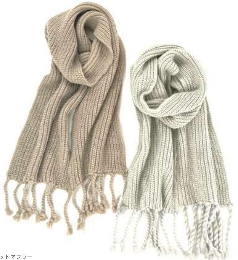
ソリッドニットマフラー ■31021 参考上代¥3,900 (税込¥4,290) Size 約26*180cm(房込) Col. Ivory Brown Quo. min Col/500pcs-China-50days