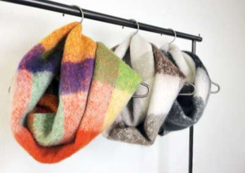
ブロックチェックポリリュームスヌード ■31008 参考上代¥2,700 (税込¥2,970) Size 約30*80*2cm Col. Multi Brown Black Quo. ポリエステル min Col/500pcs-China-50days