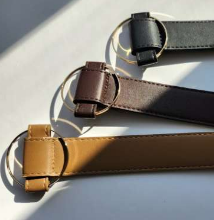
サークルピンレスベルト ■37050 参考上代¥2,500(税込¥2,750) Size 2.8cm*約96cm Col. Camel D,Brown Black Quo.合成皮革 min Col./20-Korea