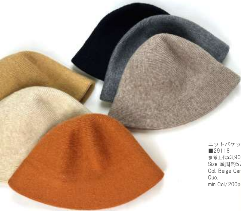
ニットバケットハット ■29118 参考上代¥3,900(税込¥4,290) Size 頭周約57cm Col. Beige Camel Orange Moca Gray Black Quo. min Col/200pcs-China-50days