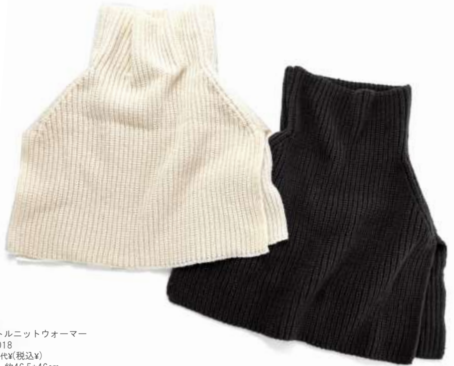
タートルニットウオーマー ■31018 参考上代¥(税込¥) Size 約46.5*46cm Col. Ivory Black Quo. min Col/500pcs-China-50days