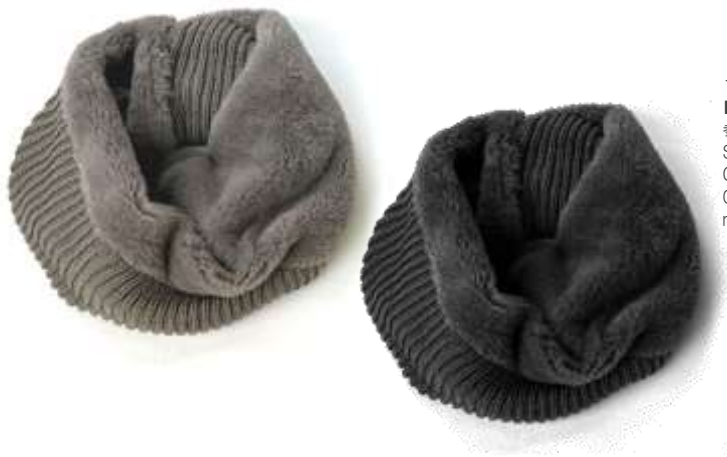
ファーニットコンビスヌード ■32200 参考上代¥4,500 (税込¥4,950) Size Col. Graige Black Quo. min Col/300pcs-China-50days