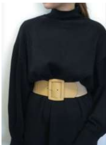
くるみバックルゴムベルト ■27030 参考上代¥3,500(税込¥3,850) Size 6.5cm*81cm Col. Beige Brown Black Quo. 合成皮革 min Col/200-China 進行有無や在庫数量が変動しますので、ご検討の際にお問合せください。