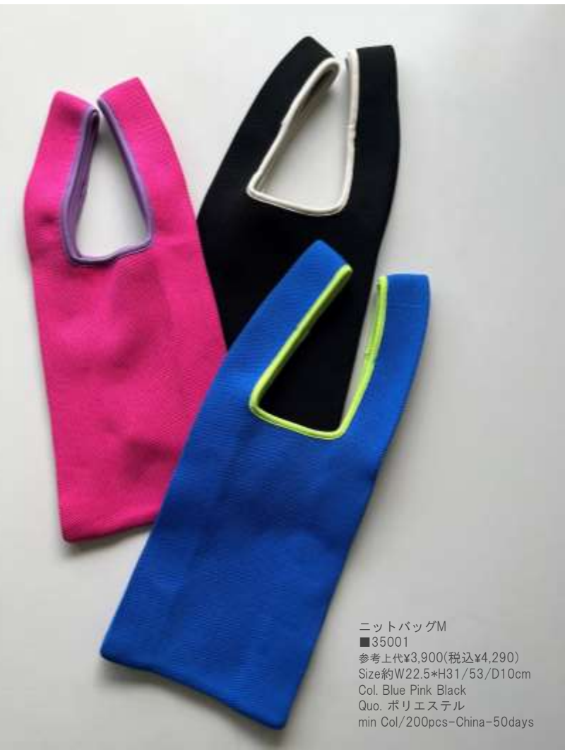
ニットバッグM ■35001 参考上代¥3,900(税込¥4,290) Size約W22.5*H31/53/D10cm Col. Blue Pink Black Quo. ポリエステル min Col/200pcs-China-50days