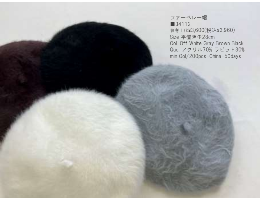
ファーベレー帽 ■34112 参考上代¥3,600(税込¥3,960) Size 平置きΦ28cm Col. Off White Gray Brown Black Quo. アクリル70% ラビット30% min Col/200pcs-China-50days