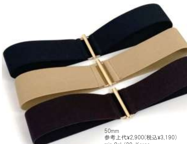
50mm 参考上代¥2,900(税込¥3,190) min Col./20-Korea