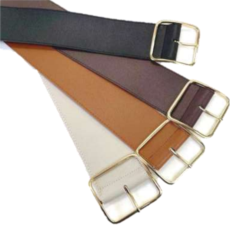
スクエアフラットベルト ■27018 参考上代¥3,700(税込¥4,070) Size 5.6cm*98cm Col. Greige Camel Brown Black Quo.合成皮革 min Col./20-Korea