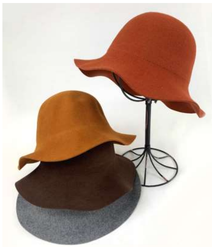
ウールハット ■29103 参考上代¥5,500(税込¥6,050) Size 頭周約57.5cmつば7.5cm Col. Camel Orange Brown Gray Quo. ウール min Col/200pcs-China-50days