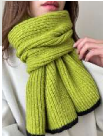
エンドバイカラーマフラー ■31026 参考上代¥3,500 (税込¥3,850) Size 約26*170cm Col. Lime Navy Beige Quo. アクリル min Col/500pcs-China-50days