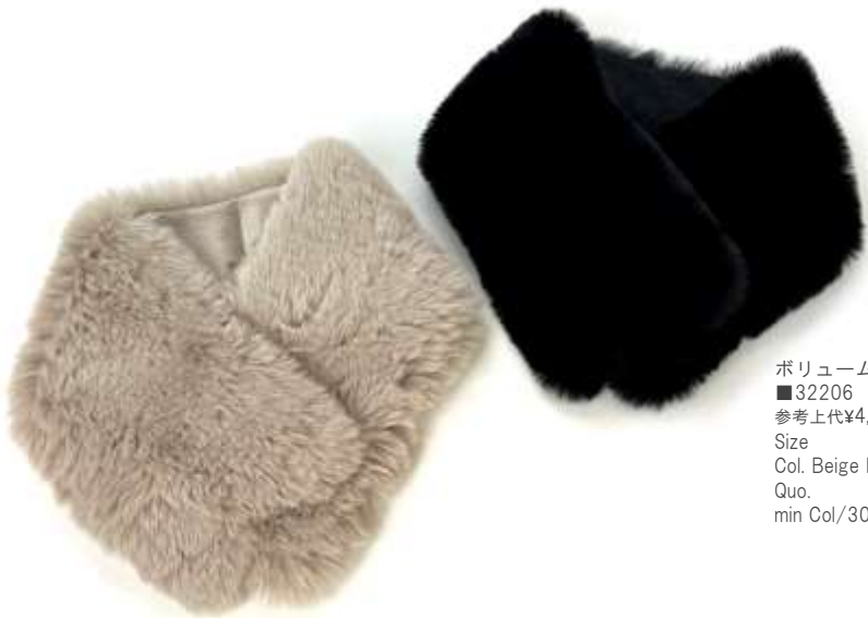
ボリュームファーマフラー ■32206 参考上代¥4,900 (税込¥5,390) Size Col. Beige Black Quo. min Col/300pcs-China-50days