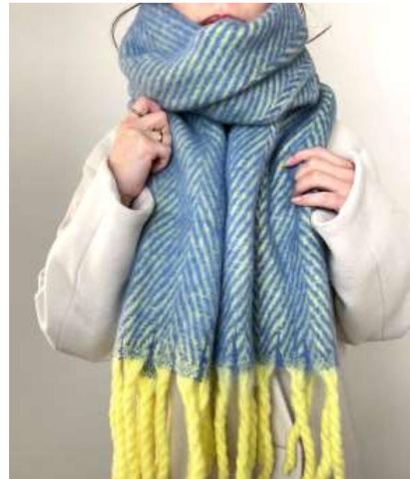
ヘリンボーンボリュームストール ■31005 参考上代¥3,200(税込¥3,520) Size 約40*210cm(房込) Col. Gray Brown Blue Quo. ポリエステル min Col/500pcs-China-50days