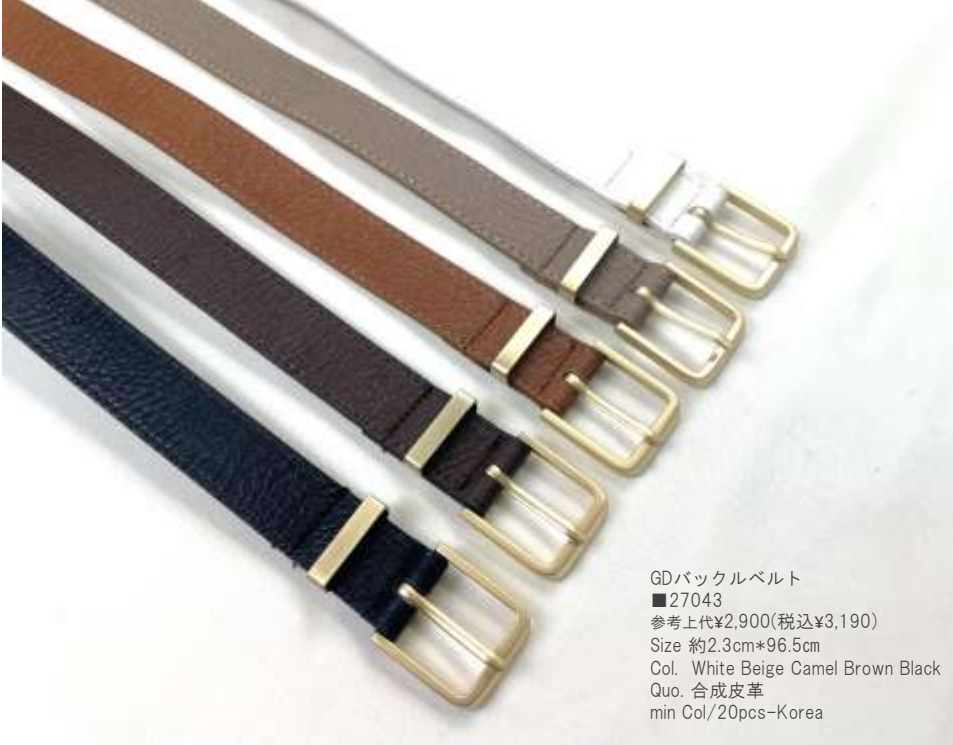
GDバックルベルト ■27043 参考上代¥2,900(税込¥3,190) Size 約2.3cm*96.5cm Col. White Beige Camel Brown Black Quo. 合成皮革 min Col/20pcs-Korea