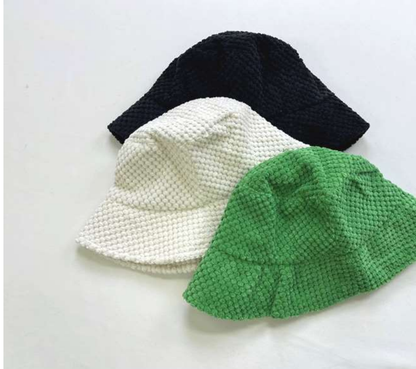
サークルポアバケットハット ■29117 参考上代¥3,900(税込¥4,290) Size 頭周約57cm Col. Off White Green Black Quo. min Col/200pcs-China-50days