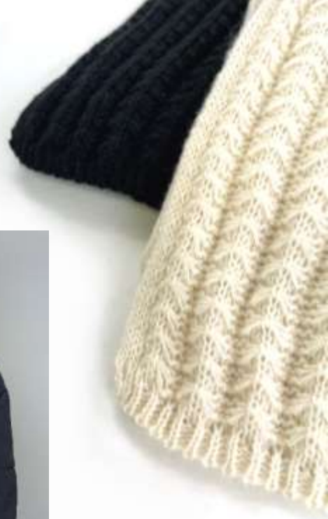
ワッフルニットマフラー ■31018 参考上代¥3,500(税込¥3,850) Size 約22*180cm Col. Ivory Wine Black Quo. ポリエステル min Col/300pcs-China-50days