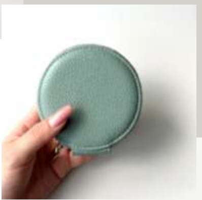
本革アクセサリーケース ■35102 参考上代¥3,500(税込¥3,850) Size 約Φ9*2cm Col. Mint Orange Pink Black Silver Gold Quo. 牛革 min Col/200pcs-China-50days