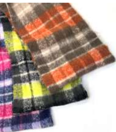
チェックポリリュームスヌード ■31007 参考上代¥2,700 (税込¥2,970) Size 約30*80*2cm Col. Brown Black Navy Quo. ポリエステル min Col/500pcs-China-50days