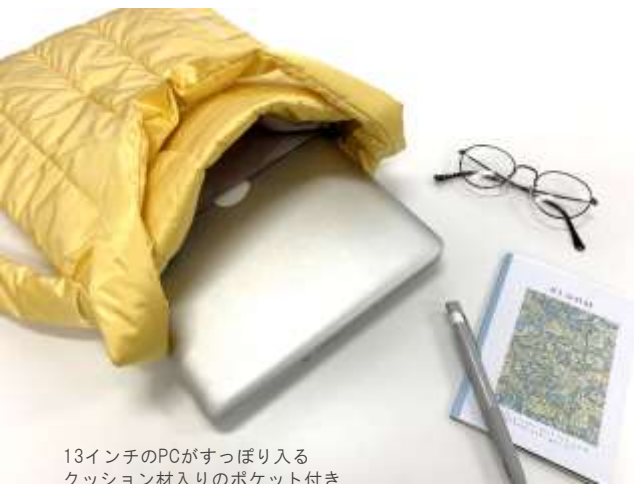
13インチのPCがすっぽり入る クッション材入りのポケット付き