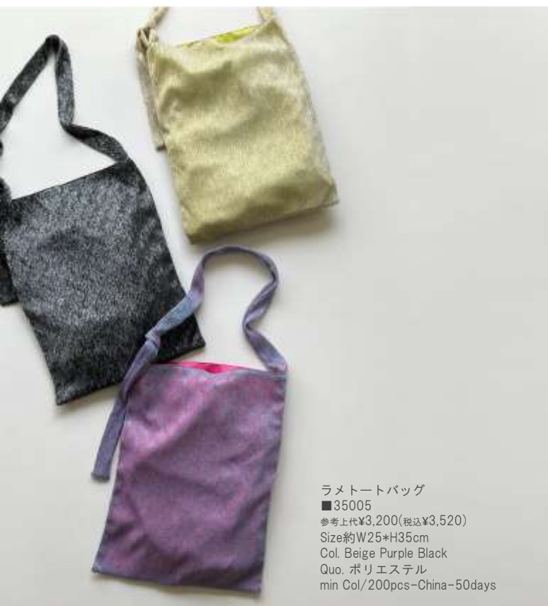
ラメトートバッグ ■35005 参考上代¥3,200(税込¥3,520) Size約W25*H35cm Col. Beige Purple Black Quo. ポリエステル min Col/200pcs-China-50days