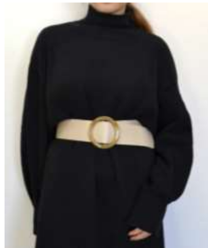
リザードアクリルバックルベルト ■27029 参考上代¥3,500(税込¥3,850) Size 5.5cm*95cm Col. Beige Brown Black Quo. 合成皮革 min Col/200-China 進行有無や在庫数量が変動しますので、ご検討の際にお問合せください。