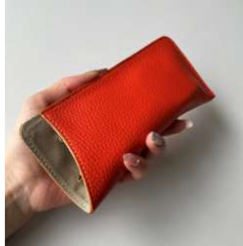
本革サングラスケース ■35105 参考上代¥2,900(税込¥3,190) Size 約17*7.5cm Col. Mint Orange Pink Black Silver Gold Quo. 牛革 min Col/200pcs-China-50days