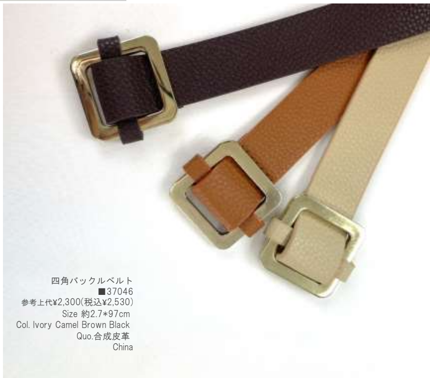
四角バックルベルト ■37046 参考上代¥2,300(税込¥2,530) Size 約2.7*97cm Col. Ivory Camel Brown Black Quo.合成皮革 China