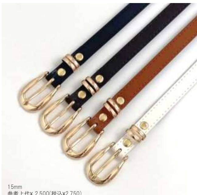
15mm 参考上代¥ 2,500(税込¥2,750) min Col./20-Korea