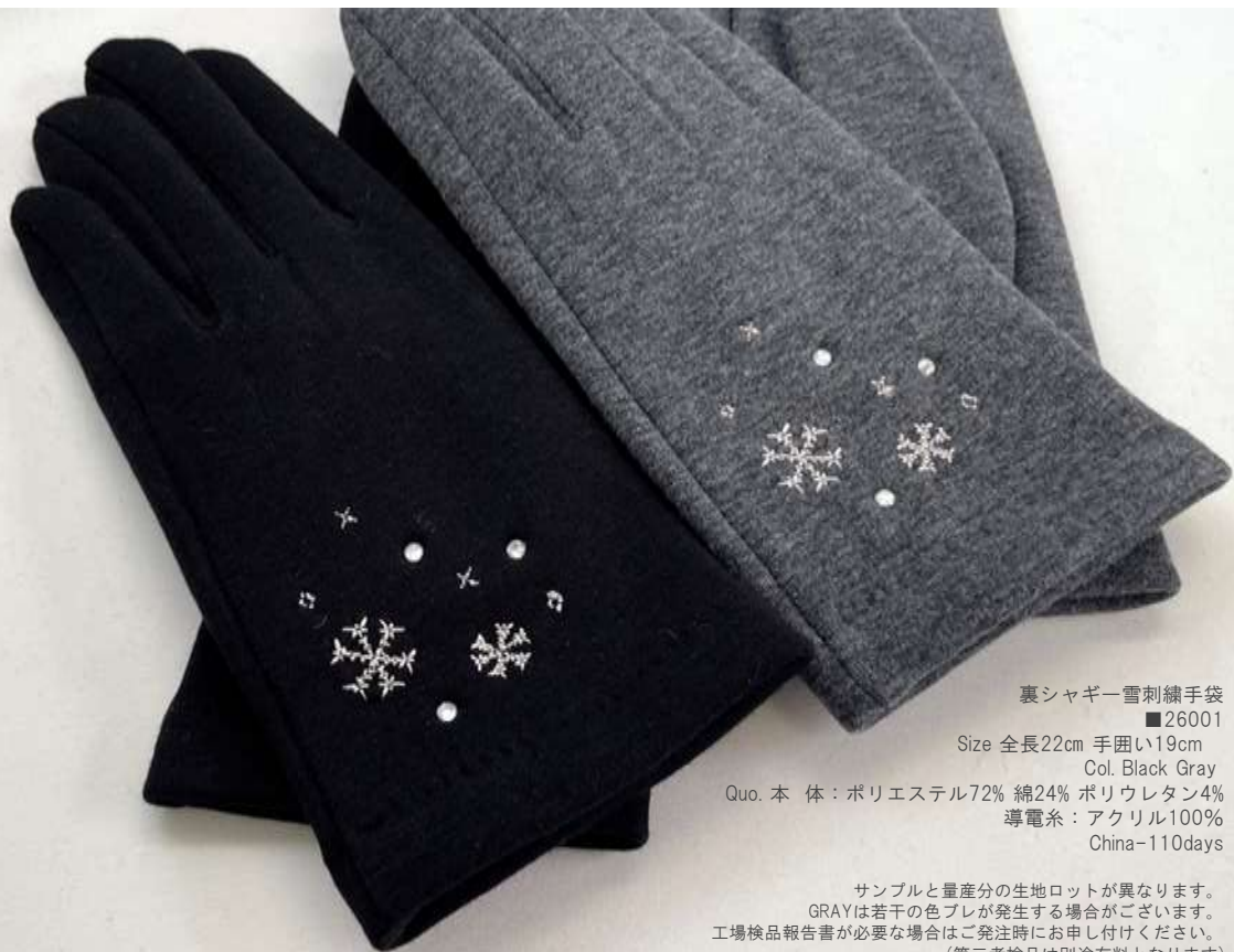
裏シャギー雪刺繍手袋 ■26001