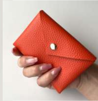
本革カードケース ■35103 参考上代¥2,500(税込¥2,750) Size 約7.5*10.5*1.5cm Col. Mint Orange Pink Black Silver Gold Quo. 牛革 min Col/200pcs-China-50days