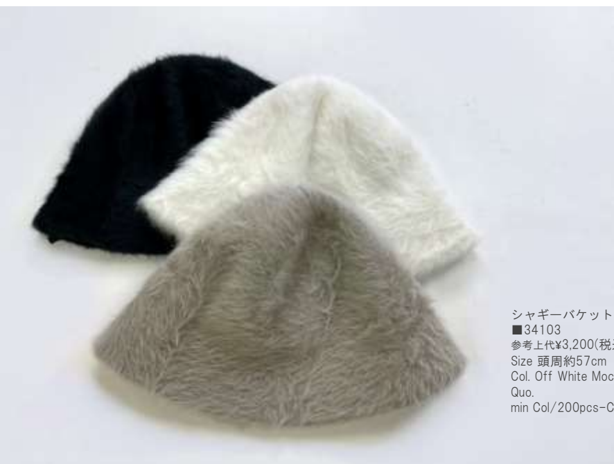
シャギーバケットハット ■34103 参考上代¥3,200(税込¥3,520) Size 頭周約57cm Col. Off White Moca Black Quo. min Col/200pcs-China-50days