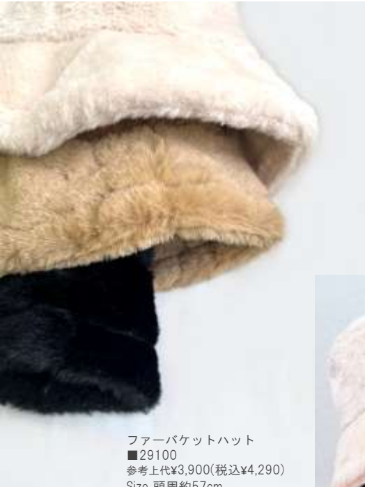
ファーバケットハット ■29100 参考上代¥3,900(税込¥4,290) Size 頭周約57cm Col. Ivory Black Camel Quo. min Col/200pcs-China-50days