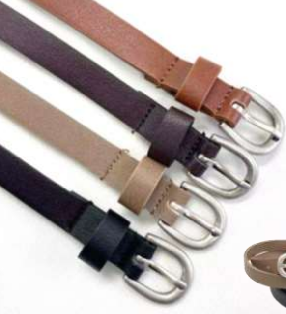
SVバックルスムーズベルト ■27003 参考上代¥1,900(税込¥2,090) Size 約1.4cm*96cm Col. Beige Camel Brown Black Quo. 合成皮革 min Col/20pcs-Korea