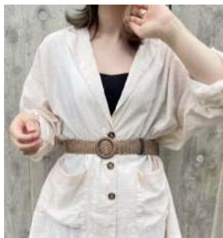
ウッドバックルベルト ■37001 参考上代¥2,900(税込¥3,190) Size 約4cm*103cm Col. Beige Brown Black Quo. ポリエステル min Col./30-China