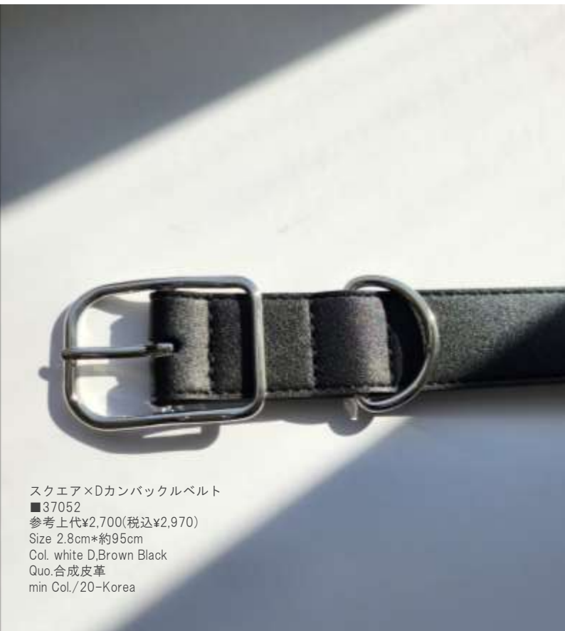
スクエア×Dカンバックルベルト ■37052 参考上代¥2,700(税込¥2,970) Size 2.8cm*約95cm Col. white D,Brown Black Quo.合成皮革 min Col./20-Korea

・在庫がある場合～20pcs～/色 ※30pcs～の場合もございます ・在庫がない場合～20pcs～/色 1-2週間は生産に必要です(要確認) 型によってミニマムが違う場合がありますのでご確認ください。仕様変更あり→50pcs～/色になる場合もございます。