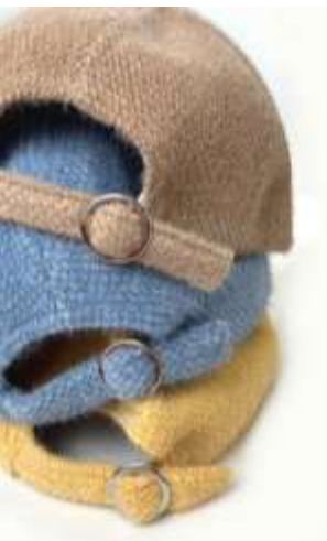
ミニシャギーロゴキャップ ■29112 参考上代¥3,500(税込¥3,850) Size 頭周約58cm つば7.5cm Col. OffWhite Beige Blue Yellow Black Quo. min Col/200pcs-China-50days