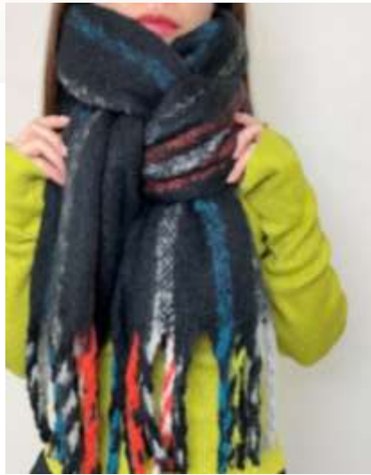
ストライプボリュームストール ■31003 参考上代¥3,200(税込¥3,520) Size 約40*210cm(房込) Col. Ivory Brown Black Quo. ポリエステル min Col/500pcs-China-50days