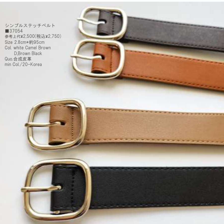
シンプルステッチベルト ■37054 参考上代¥2,500(税込¥2,750) Size 2.8cm*約95cm Col. white Camel Brown D,Brown Black Quo.合成皮革 min Col./20-Korea