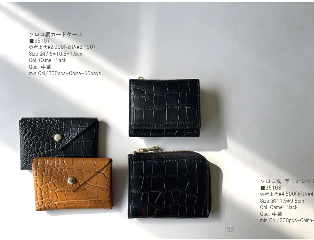
クロコ調カードケース ■35107 参考上代¥2,900(税込¥3,190) Size 約7.5*10.5*1.5cm Col. Camel Black Quo. 牛革 min Col/200pcs-China-50days