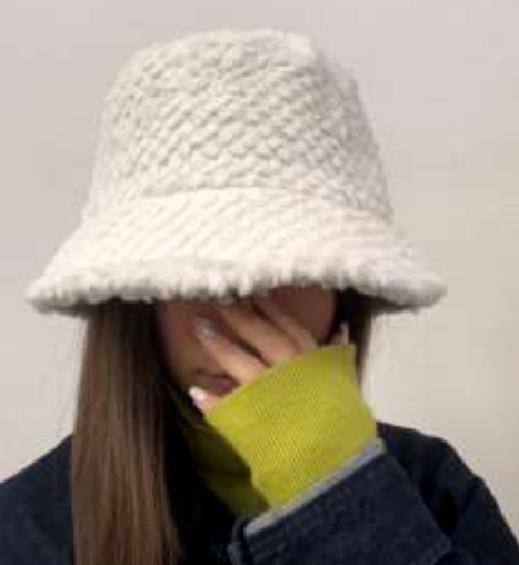
フェイクファーバケットハット ■34111 参考上代¥3,200(税込¥3,520) Size 頭周約57cm Col. Off White Pinkbeige Pink Mintblue Black Quo. min Col/200pcs-China-50days