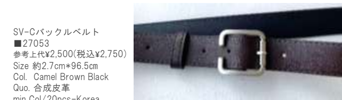
SV-Cバックルベルト ■27053 参考上代¥2,500(税込¥2,750) Size 約2.7cm*96.5cm Col. Camel Brown Black Quo. 合成皮革 min Col/20pcs-Korea