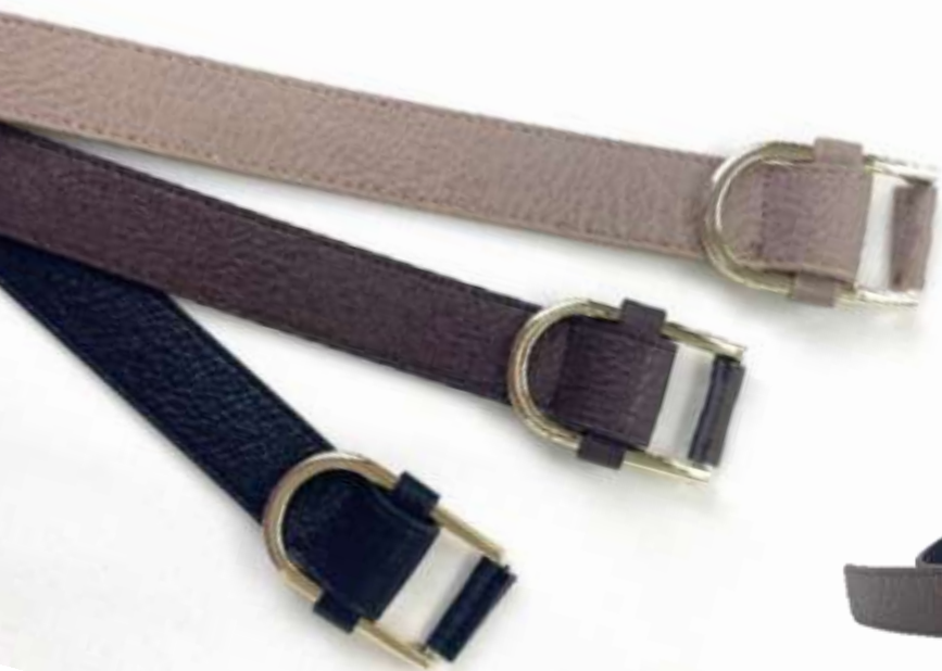
Dバックルベルト ■27049 参考上代¥2,900(税込¥3,190) Size 約2.3cm*98cm Col. Beige Brown Black Quo. 合成皮革 min Col/20pcs-Korea