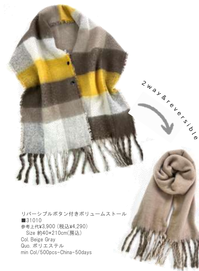
リバーシブルボタン付きボリュームストール ■31010 参考上代¥3,900 (税込¥4,290) Size 約40*210cm(房込) Col. Beige Gray Quo. ポリエステル min Col/500pcs-China-50days