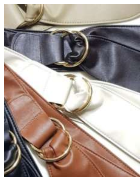
参考上代¥4,200(税込¥4,620) min Col./20-Korea