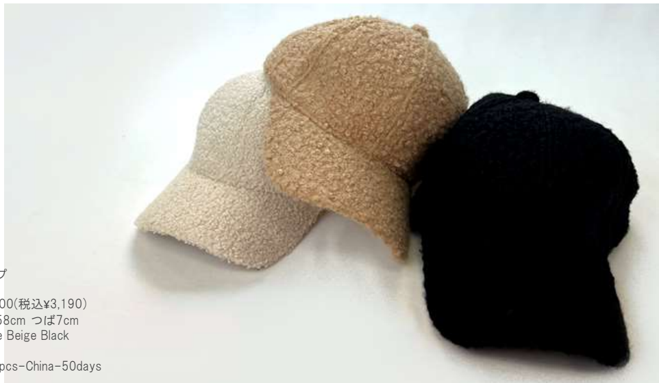
ポアキャップ ■29105 参考上代¥2,900(税込¥3,190) Size 頭周約58cm つば7cm Col. OffWhite Beige Black Quo. min Col/200pcs-China-50days