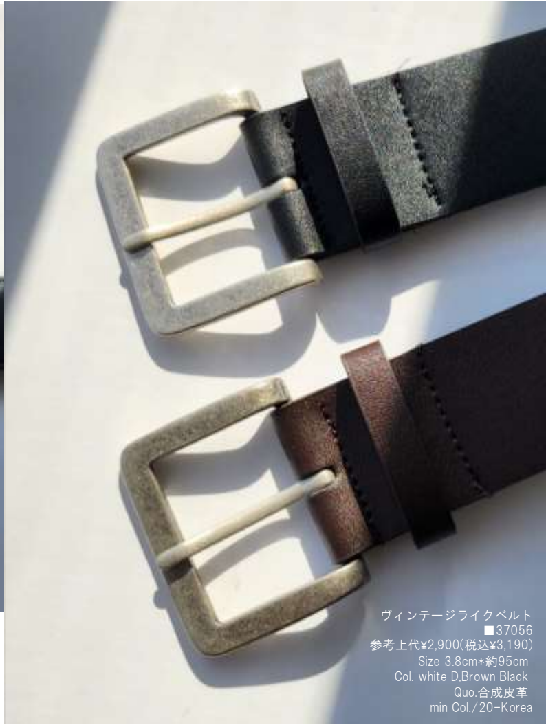
ヴィンテージライクベルト ■37056 参考上代¥2,900(税込¥3,190) Size 3.8cm*約95cm Col. white D,Brown Black Quo.合成皮革 min Col./20-Korea