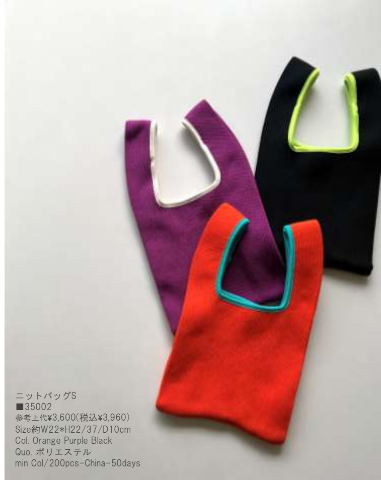
ニットバッグS ■35002 参考上代¥3,600(税込¥3,960) Size約W22*H22/37/D10cm Col. Orange Purple Black Quo. ポリエステル min Col/200pcs-China-50days