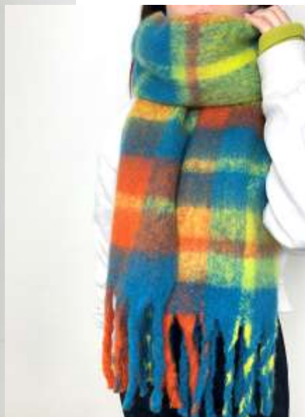
チェックボリュームストール ■31004 参考上代¥3,200(税込¥3,520) Size 約40*210cm(房込) Col. Pink Blue Beige Black Quo. ポリエステル min Col/500pcs-China-50days