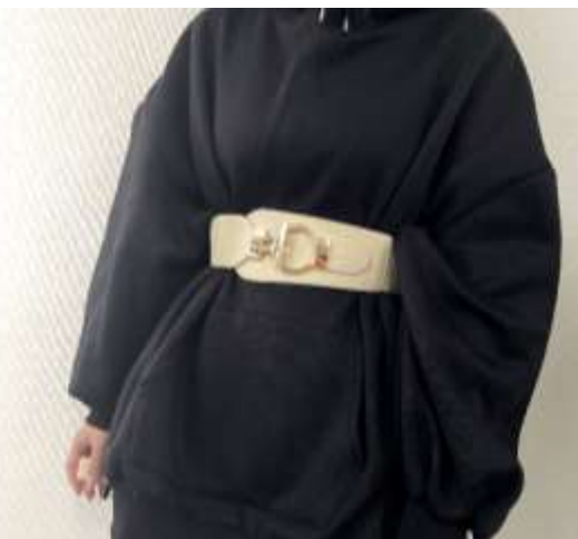
サークル太ゴムベルト ■27052 参考上代¥4,900(税込¥5,390) Size 約5.8cm*71.5cm Col. Beige Brown Black Quo. 合成皮革 min Col./20-China