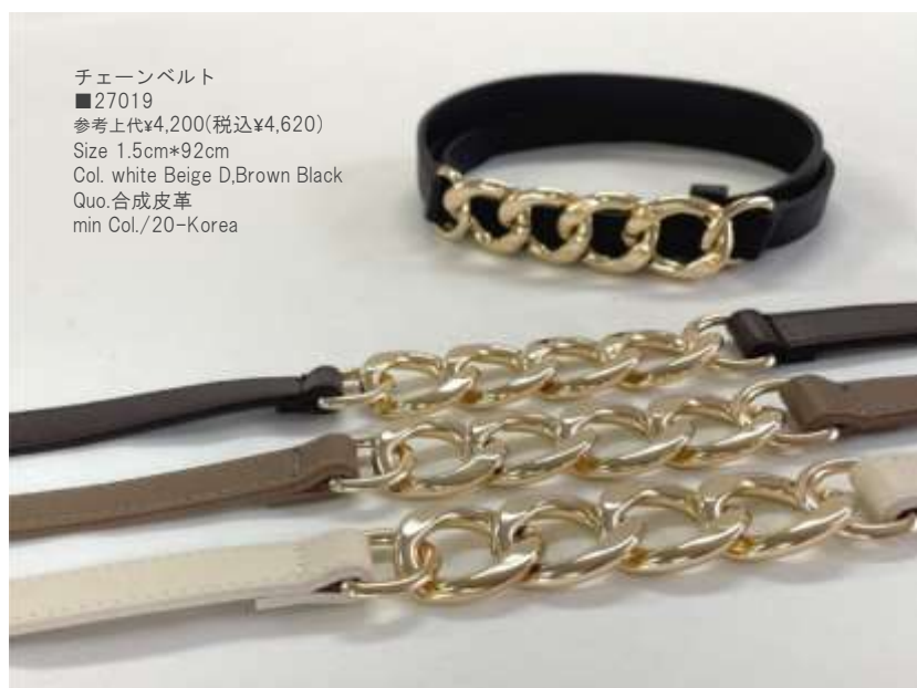
チェーンベルト ■27019 参考上代¥4,200(税込¥4,620) Size 1.5cm*92cm Col. white Beige D,Brown Black Quo. 合成皮革 min Col./20-Korea

q u i c k d e l i v e r y b e l t s e r i e s