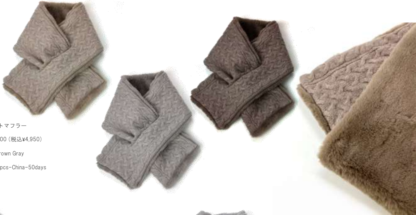
ファーニットマフラー ■32201 参考上代¥4,500 (税込¥4,950) Size Col. Beige Brown Gray Quo. min Col/300pcs-China-50days