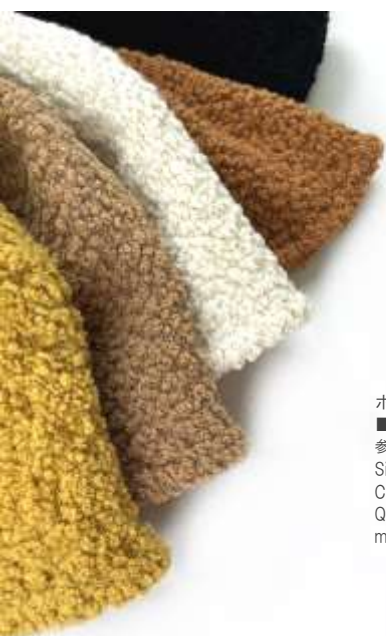
ボアチューリップハット ■29109 参考上代¥3,900(税込¥4,290) Size 頭周約57cm Col. Green Black Quo. min Col/200pcs-China-50days