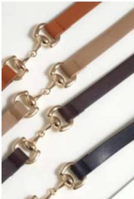
参考上代¥3,700(税込¥4,070) min Col./20-Korea