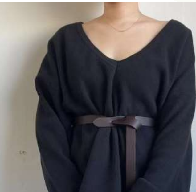
タイベルト ■27005 参考上代¥2,200(税込¥2,420) Size 約2.4cm*121cm Col. Brown Black Quo. 合成皮革 min Col/20pcs-Korea