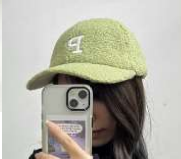
ポアロゴキャップ ■34102 参考上代¥2,900(税込¥3,190) Size 頭周約58cm つば7cm Col. OffWhite Pistachio Blue Yellow Lt,Gray Quo. min Col/500pcs-China-50days