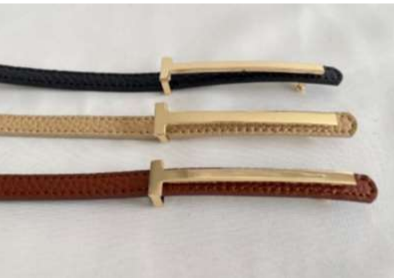
Tバックルベルト ■27017 参考上代¥2,500(税込2,750) Size 1cm*94cm Col. Beige Camel Black Quo.合成皮革 min Col./20-Korea