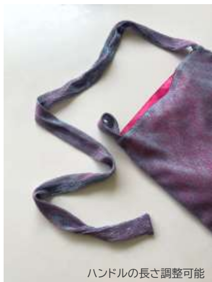
ハンドルの長さ調整可能