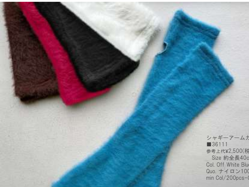
シャギーアームカバー ■36111 参考上代¥2,500(税込¥2,750) Size 約全長40cm Col. Off White Blue Pink Brown Black Quo. ナイロン100% min Col/200pcs-China-50days