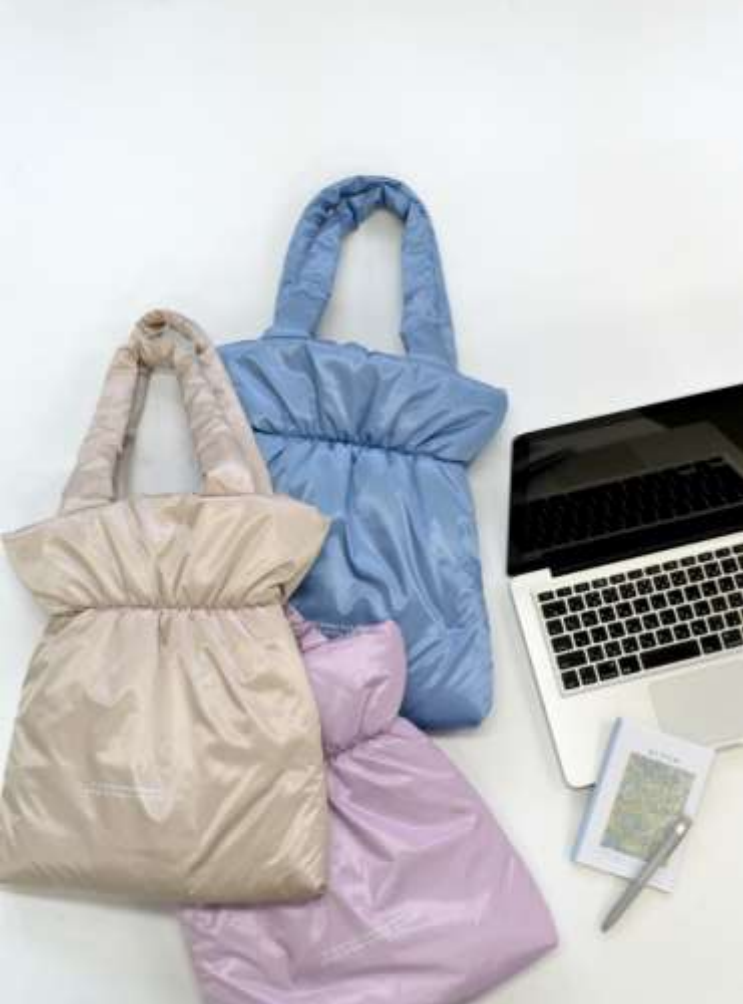
サテングァザーPCバッグ ■25002 参考上代¥3,900(税込¥4,290) Size 約W33*H40*D5cm Col. Beige Purple Blue Quo. ポリエステル min Col/400pcs-China-50days