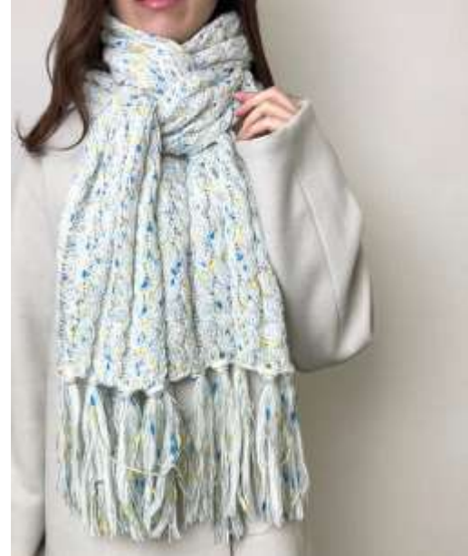
ラメヤーンニットマフラー ■31020 参考上代¥3,900 (税込¥4,290) Size 約26*204cm(房込) Col. Off White Brown Quo. min Col/500pcs-China-50days