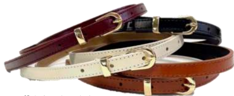
GDバックルスムーズベルト ■27004 参考上代¥2,900(税込¥3,190) Size 約1.1cm*96cm Col. White Wine Brown Black Quo. 合成皮革 min Col/20pcs-Korea