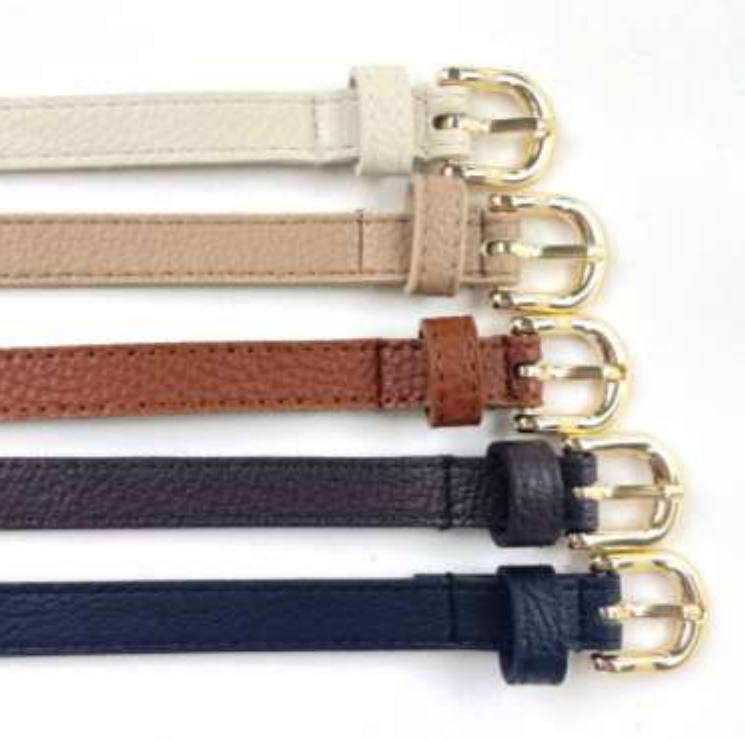
GDバックルしほベルト ■27051 参考上代¥1,900(税込¥2,090) Size 約1.4cm*96.5cm Col. White Beige Camel Brown Black Quo. 合成皮革 min Col./20pcs-Korea