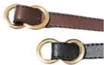
15mm double ring 参考上代¥ 2,500(税込¥2,750) min Col./20-Korea