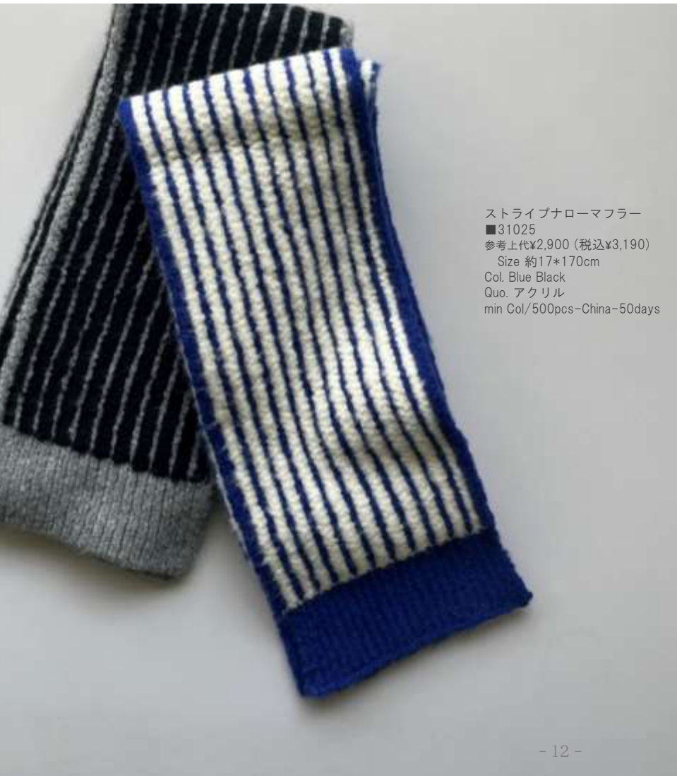
ストライプナローマフラー ■31025 参考上代¥2,900 (税込¥3,190) Size 約17*170cm Col. Blue Black Quo. アクリル min Col/500pcs-China-50days