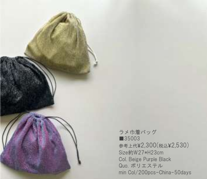
ラメ巾着バッグ ■35003 参考上代¥2,300(税込¥2,530) Size約W27*H23cm Col. Beige Purple Black Quo. ポリエステル min Col/200pcs-China-50days