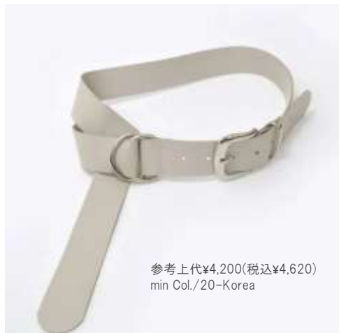
参考上代¥4,200(税込¥4,620) min Col./20-Korea