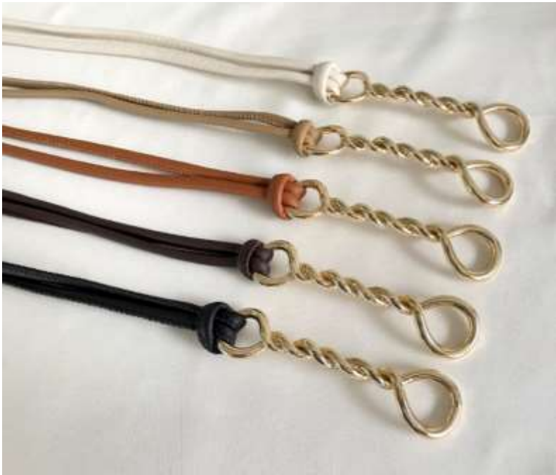
ツイストベルト ■27016 参考上代¥4,900(税込¥5,390) Size 1.4cm*122cm Col. White Beige Camel Brown Black Quo.合成皮革 min Col./20-Korea