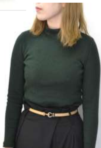
ピットスライドベルト ■27024 参考上代¥2,500(税込¥2,750) Size 1cm*51~90.5cm Col. Beige Brown Black Quo. 合成皮革 min Col/200-China