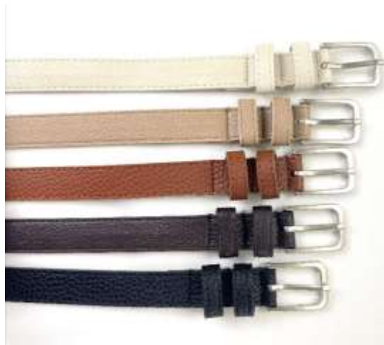
SVバックルベルト ■27054 参考上代¥2,500(税込¥2,750) Size 約2cm*97cm Col. White Beige Brown D,Brown Black Quo. 合成皮革 min Col/20pcs-Korea