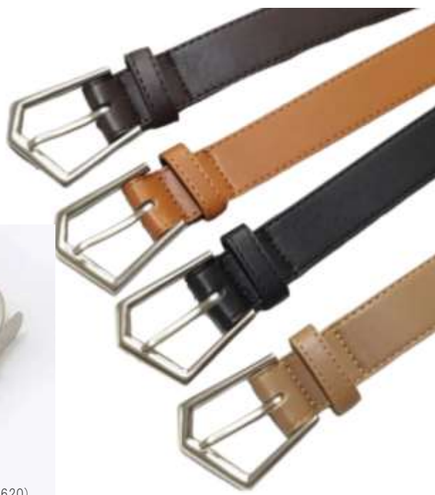
参考上代¥ 2,500(税込¥2,750) min Col./20-Korea