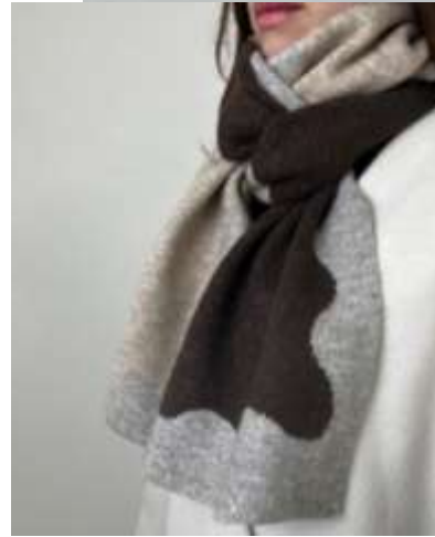
ウェーブ切替マフラー ■31023 参考上代¥3,500 (税込¥3,850) Size 約25*164cm Col. Pink Brown Quo. アクリル min Col./500pcs-China-50days