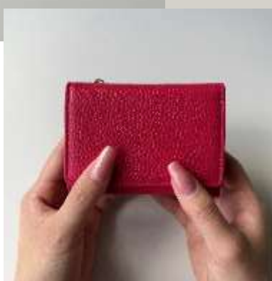
本革三つ折りミニウォレット ■35100 参考上代¥5,500(税込¥6,050) Size 約10*7.5*3.5cm Col. Mint Orange Pink Black Silver Gold Quo. 牛革 min Col/200pcs-China-50days