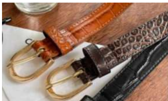
20mm 参考上代¥ 2,500(税込¥2,750) min Col./20-Korea